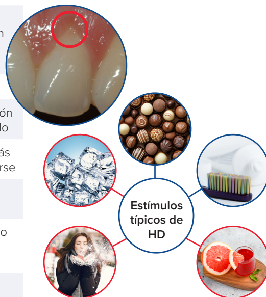
Figure 2: Manifestaciones clínicas y síntomas